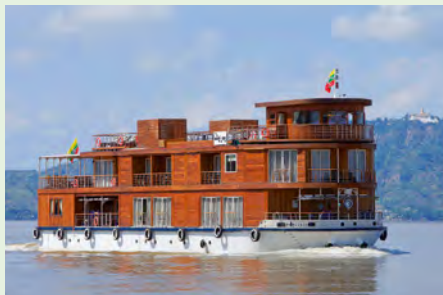
Sie fahren mit der RV Paukan 2012. Details finden Sie auf Seite 47.

„Der 2.170 km lange Irrawaddy ist auf einer Länge von 1.337 km schiffbar. Sie erleben fast die gesamte Strecke!“