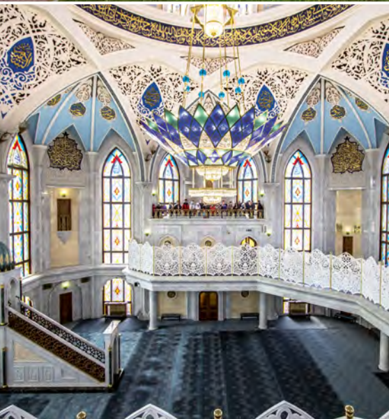
In der Kul-Scharif-Moschee in Kasan

auf Wunsch von einer ca. einstündigen abendlichen Lichterfahrt durch die Stadt mit Stopp am Roten Platz und von einer Metro-Fahrt mit Besuch zweier besonders schöner Stationen verzaubern ( Ausflugspaket ). (FMA)