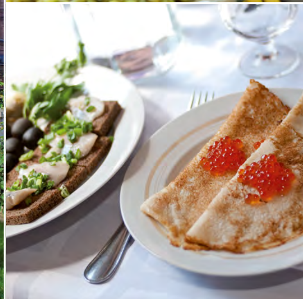
Wodka-Probe mit typisch russischen Snacks und rotem Kaviar

das Dramentheater, das neue Zaren-Denkmal und die Markthalle. Gegen Mittag können Sie an einem spannenden Ausflug teilnehmen, bei dem Sie das Freilichtmuseum Leben und Arbeiten im alten Sibirien besichtigen ( Ausflugspaket ). Heute Nacht logieren Sie im Hotel in Irkutsk ( FA )