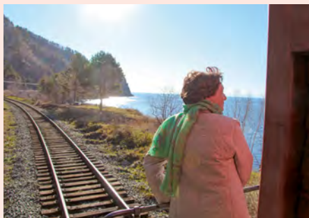
Sie fahren mit dem Zarengold-Sonderzug. Details finden Sie ab Seite 56.

„20 Jahre Zarengold! Wenn das nicht historisch genug ist, um unseren Sonderzug zum Jubiläum auf der historischen Route rollen zu lassen!“