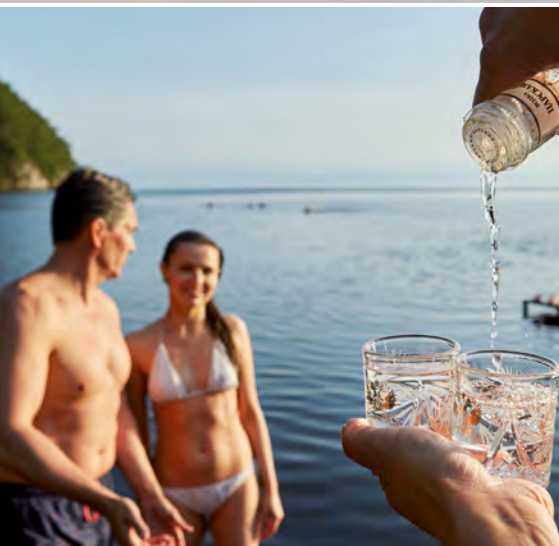
Nach dem Bad im Baikalsee

sität, zum Neujungfrauen-Kloster sowie zum Roten Platz mit der farbenprächtigen Basilius-Kathedrale, zur berühmten ehemaligen KGB-Zentrale und zum Weißen Haus. Nach Ihrem Abendessen lassen Sie sich auf Wunsch von einer ca. einstündigen abendlichen Lichterfahrt durch die Stadt mit Stopp am Roten Platz und von einer Metro-Fahrt mit Besuch zweier besonders schöner Stationen verzaubern ( Ausflugspaket ). (FMA)