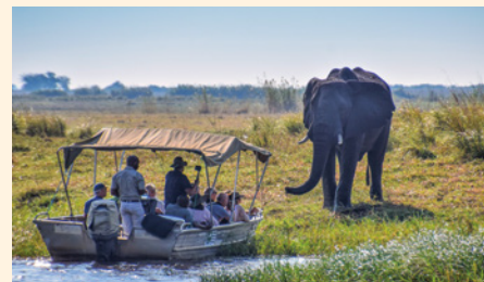
Safari per Boot im Chobe-Nationalpark

Nicht enthalten: Visum Simbabwe (30 US-$, vor Ort), Trinkgelder