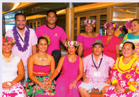
Sie fahren mit dem Postschiff Aranui 5.