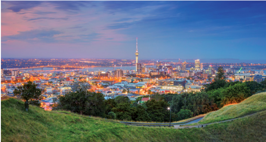
Auckland – City of Sails