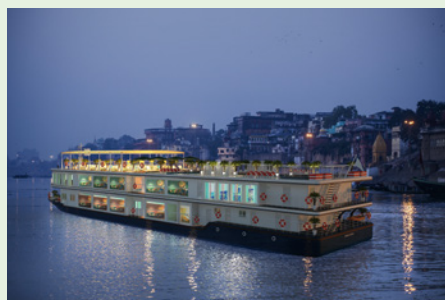
Sie fahren mit der RV Thurgau Ganga Vilas.

„Ein Bad im Ganges reinigt von allen Sünden. Hindus wollen in Varanasi sterben und ihre Asche im Ganges verstreut wissen.“