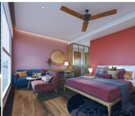
Kabine auf dem Hauptdeck