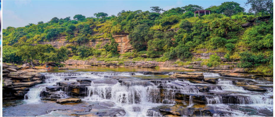
Per Rikscha durch Indien