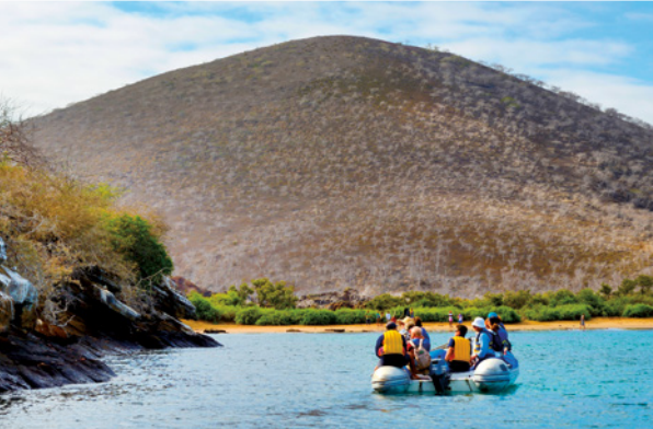
Ausflug per Zodiac