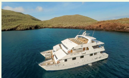
Sie fahren mit der MC Galápagos Seaman Journey.

Die Reise ist kombinierbar mit einer Vorreise in Peru nach Cusco und Machu Picchu (Reise-ID: 1961) sowie mit einer Verlängerung in Ecuador auf der Straße der Vulkane durch die Anden (Reise-ID: 1548).